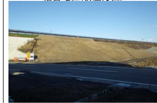
福宮地区(新庄方面)