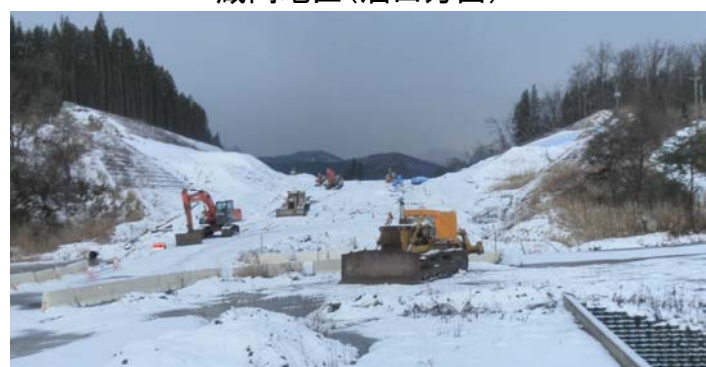
蔵岡地区(酒田方面)