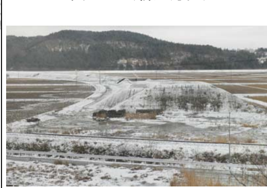
津谷地区(新庄方面)