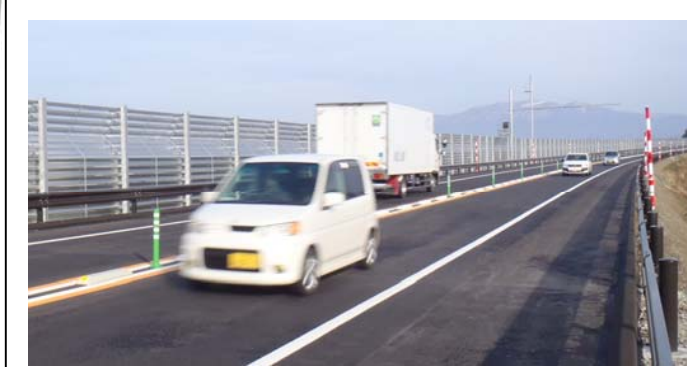
新庄古口道路(本合海~升形) L=2.4km