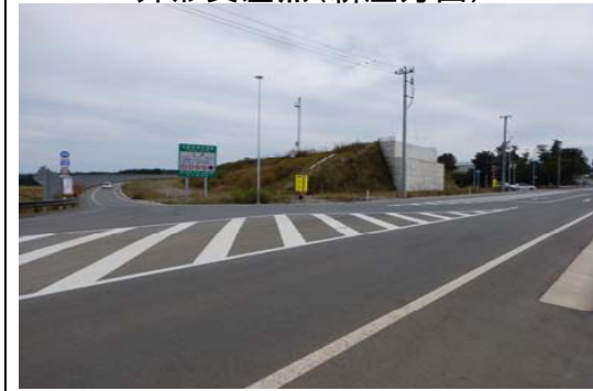
升形交差点(新庄方面)