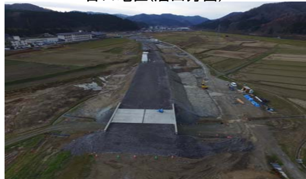
古口地区(酒田方面)