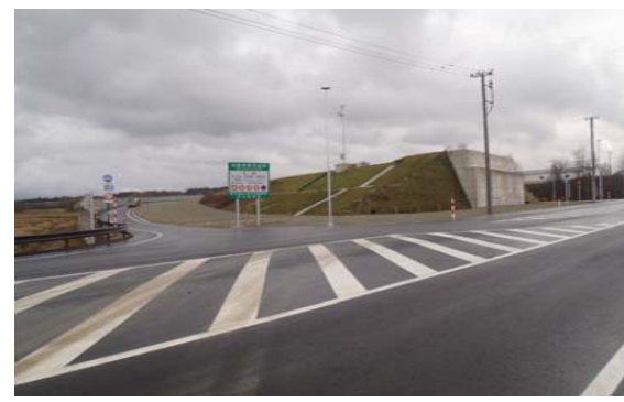
升形交差点(新庄方面)