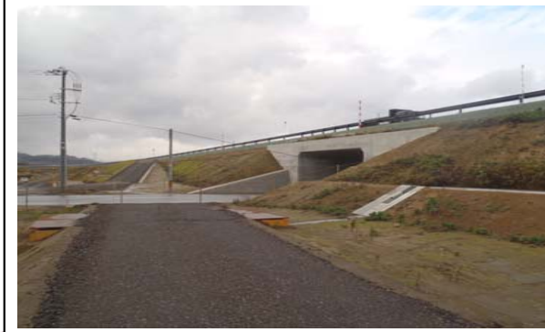
福宮地区(酒田方面)