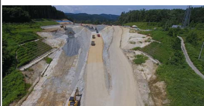
津谷地区(酒田方面)