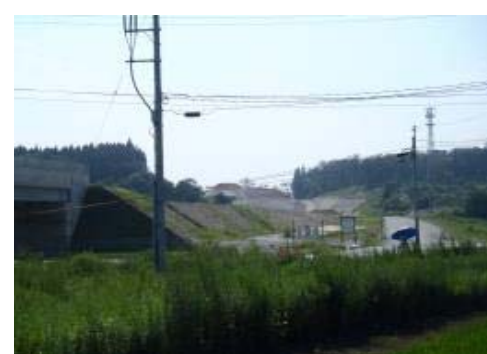
津谷地区(酒田方面)