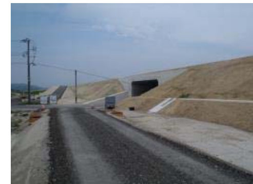
福宮地区(酒田方面)