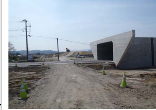
福宮地区(酒田方面)