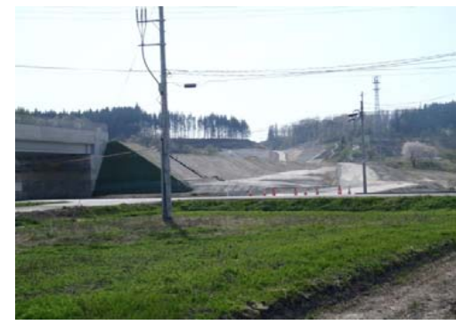
津谷地区(酒田方面)