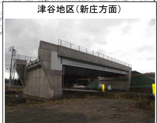
津谷地区(新庄方面)