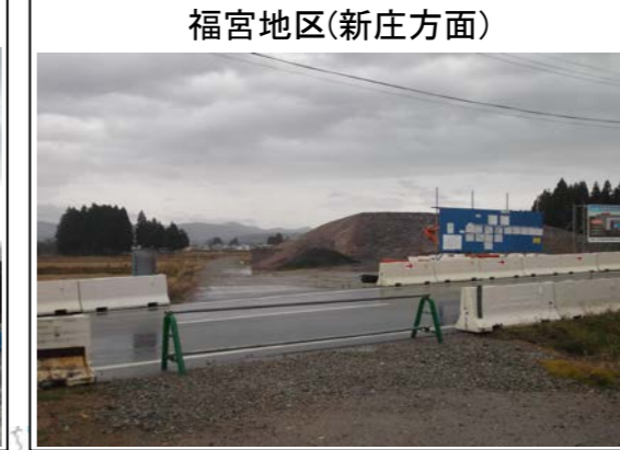
福宮地区(新庄方面)