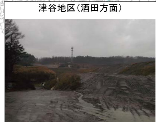
津谷地区(酒田方面)