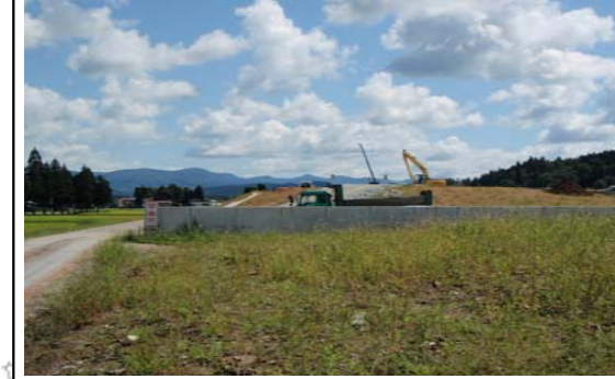
福宮地区(新庄方面)