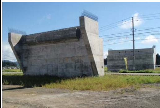
津谷地区(新庄方面)