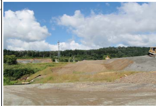
津谷地区(酒田方面)