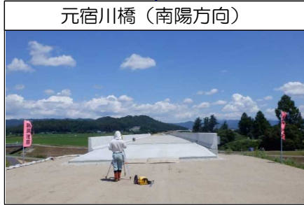
元宿川橋(南陽方向)