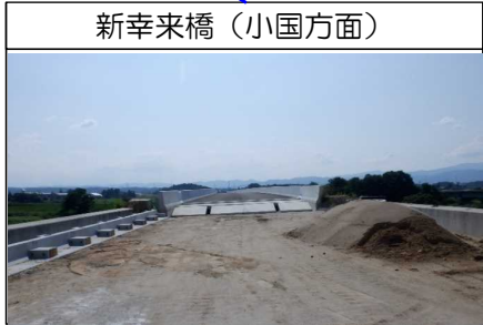
新幸来橋(小国方面)