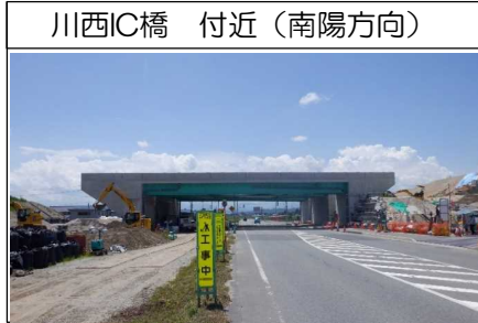
川西IC橋 付近(南陽方向)