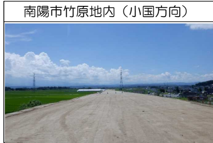
南陽市竹原地内(小国方向)