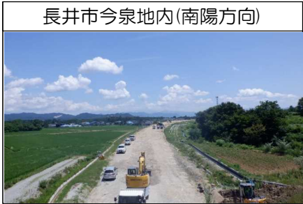
長井市今泉地内(南陽方向)