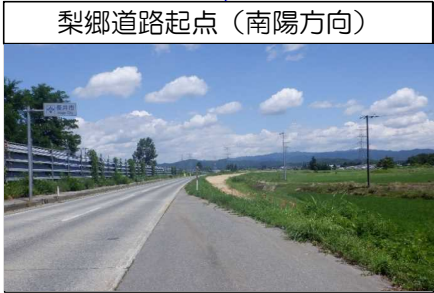
梨郷道路起点(南陽方向)