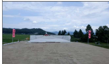
元宿川橋 (南陽方向)