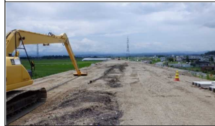
南陽市竹原地内 (小国方向)