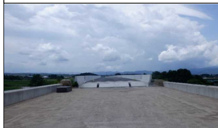
新幸来橋 (小国方面)