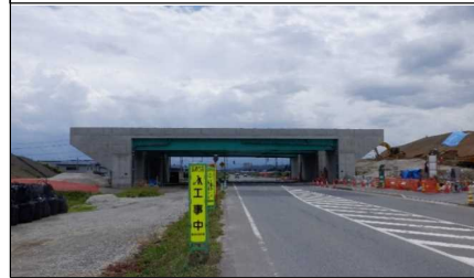
川西IC橋 付近 (南陽方向)