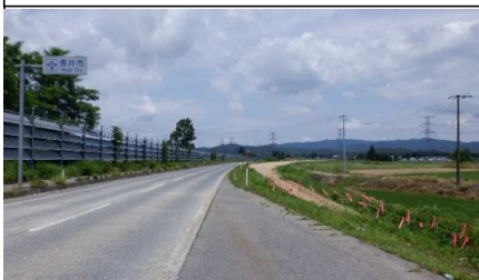
梨郷道路起点 (南陽方向)