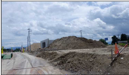
川西町西大塚 地内(高畠方向)