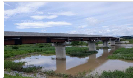
新幸来橋(小国方向)