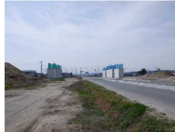
川西町西大塚 地内(小国方向)