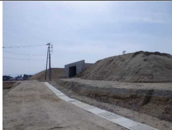
川西町西大塚 地内(高畠方向)