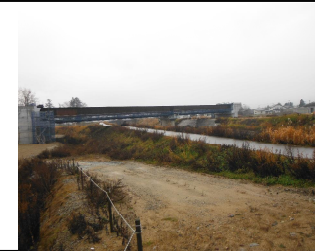
川西町大塚 地内(長井方向)