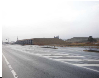
川西町西大塚 地内(長井方向)