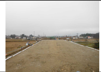
川西町西大塚 地内(長井方向)