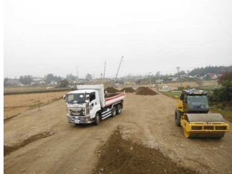
川西町西大塚 地内(長井方向)