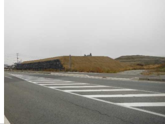
川西町西大塚 地内(長井方向)