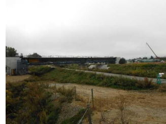
川西町大塚 地内(長井方向)