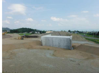
川西町西大塚 地内(米沢方面)