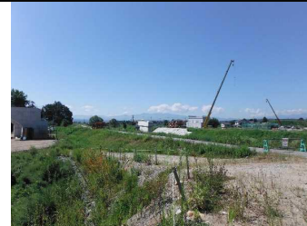
川西町大塚 地内(長井方面)