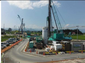
川西町西大塚 地内(長井方面)