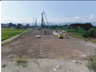
川西町西大塚 地内(長井方面)