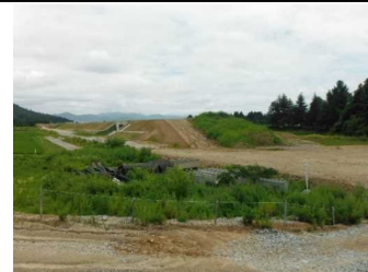
川西町大塚 地内(米沢方面)