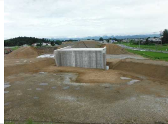
川西町西大塚 地内(米沢方面)