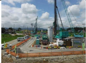
川西町西大塚 地内(長井方面)