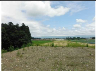
川西町西大塚 地内(米沢方面)