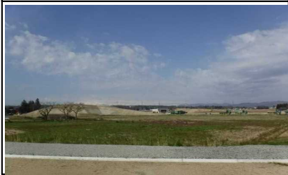
川西町西大塚 地内 (長井方面)