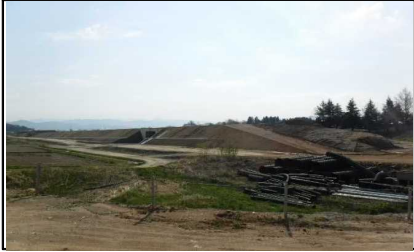
川西町大塚 地内 (米沢方面)