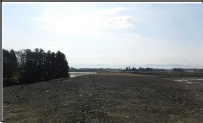
川西町西大塚 地内 (米沢方面)