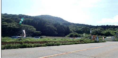
小国トンネル 終点側