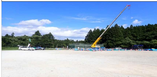
横川に線橋 起点側