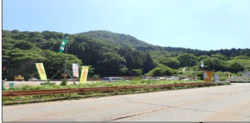
小国トンネル 終点側