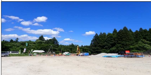
横川に線橋 起点側