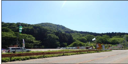
小国トンネル 終点側