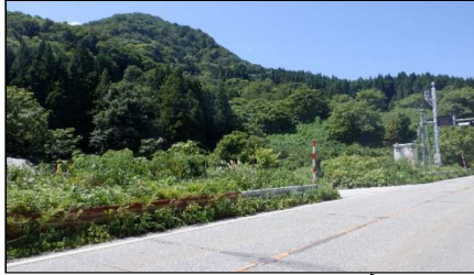
小国トンネル 終点側