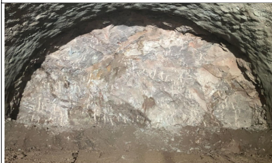
新及位トンネル（切羽写真）