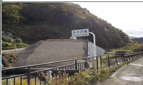
及位地区 (新及位トンネル終点側新庄方向)