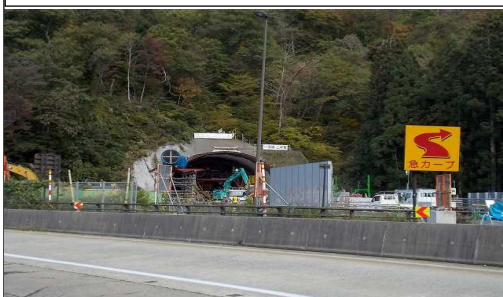
及位地区 (新及位トンネル起点横手方向)