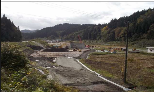
及位地区 (新庄方向)