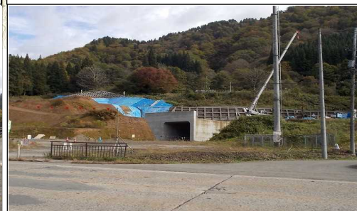
及位地区 (横手方向)