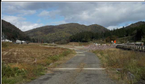
及位地区 (横手方向)