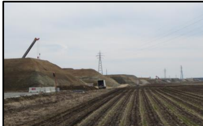
西郷地区(山形方向)