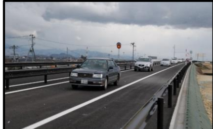
東根IC～東根北IC (H31.3.23 開通)