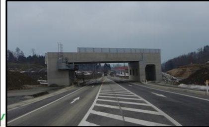
村山北(1)IC橋 (新庄方向)