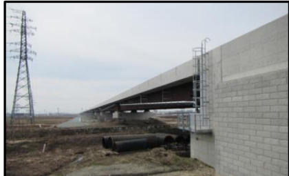
西郷高架橋A2側(山形方向)