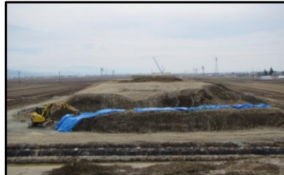
浮沼地区 (山形方向)