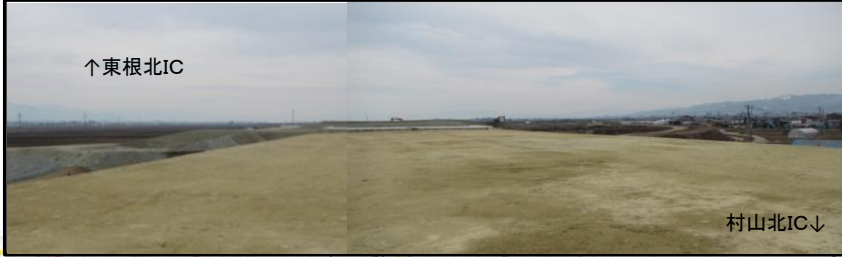
村山IC(仮称) (山形方向)