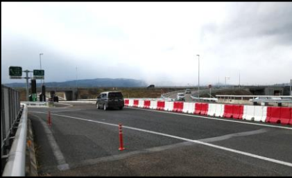
東根IC～東根北IC (H31.3.23 開通)