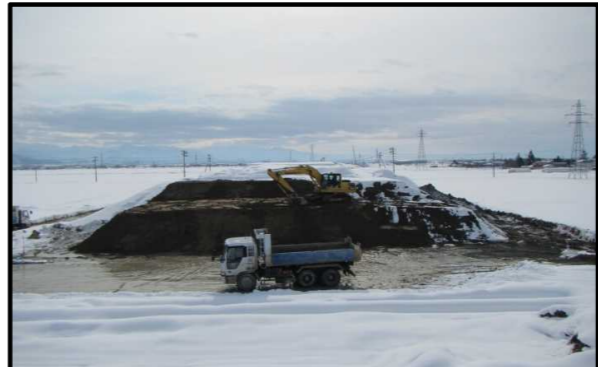
浮沼地区 (山形方向)