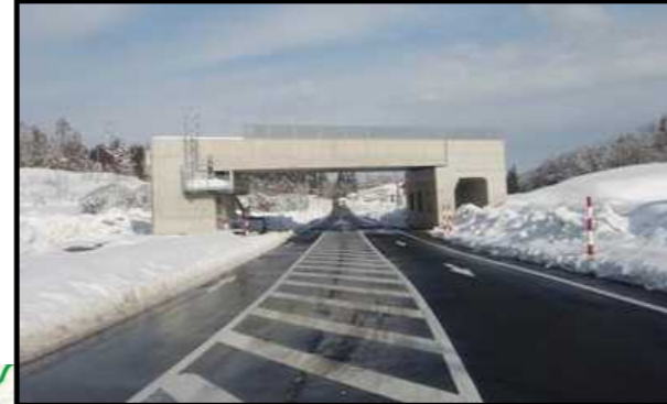
村山北(1)IC橋 (山形方向)