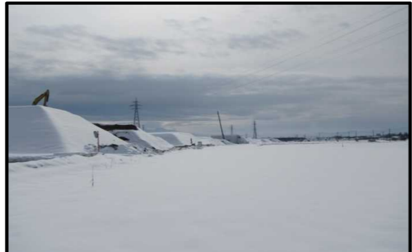
西郷地区(山形方向)