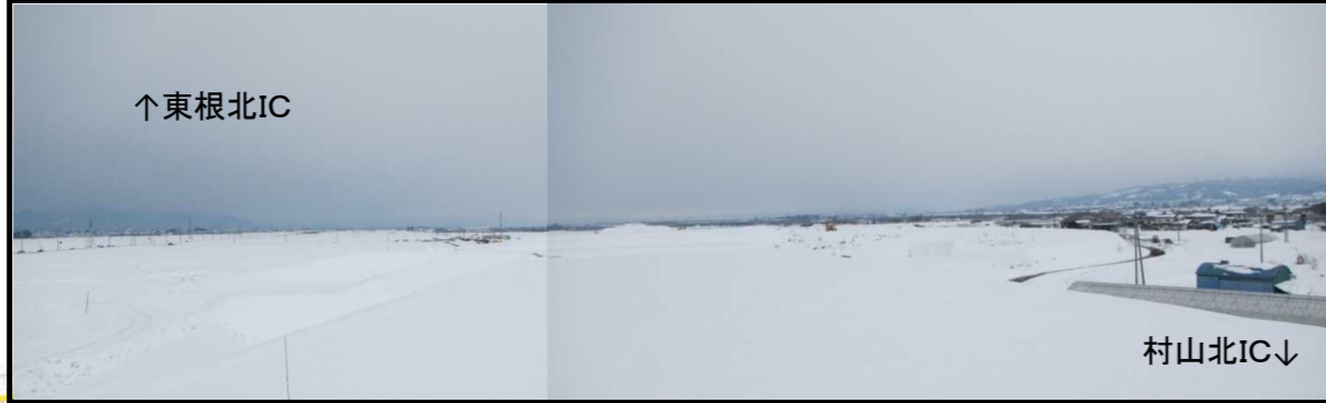
村山IC(仮称) (山形方向)