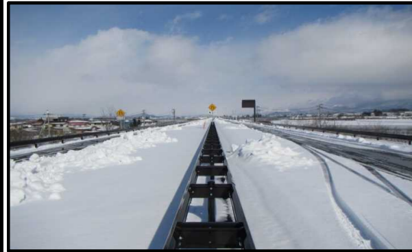
羽入地区(新庄方向)