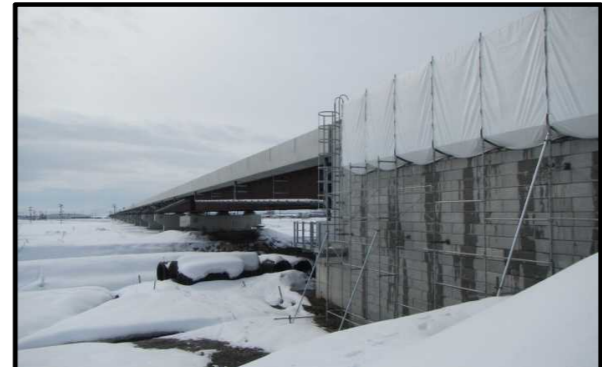
西郷高架橋A2側(山形方向)