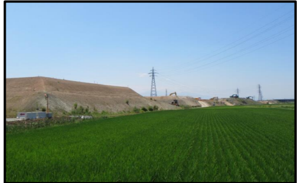
西郷地区(山形方向)