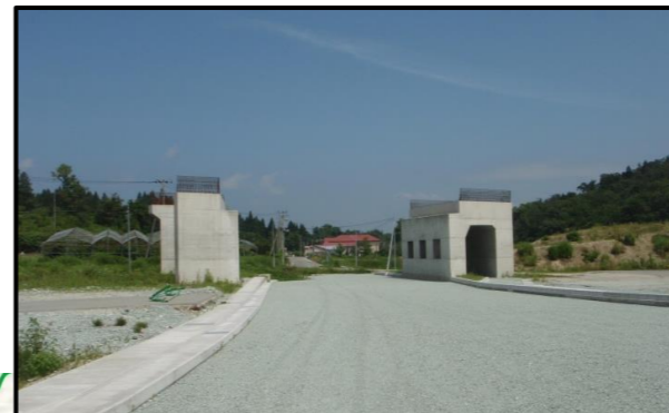
村山北(1)IC橋 (新庄方向)