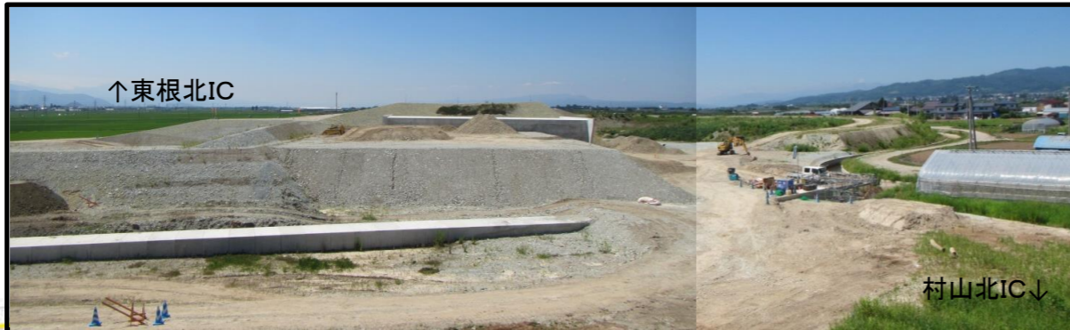
村山IC(仮称) (山形方向)