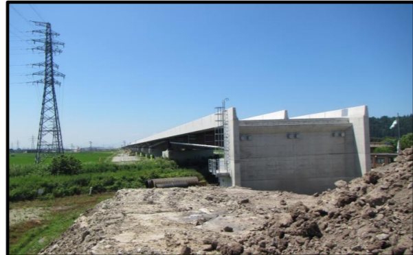
西郷高架橋A2側(山形方向)