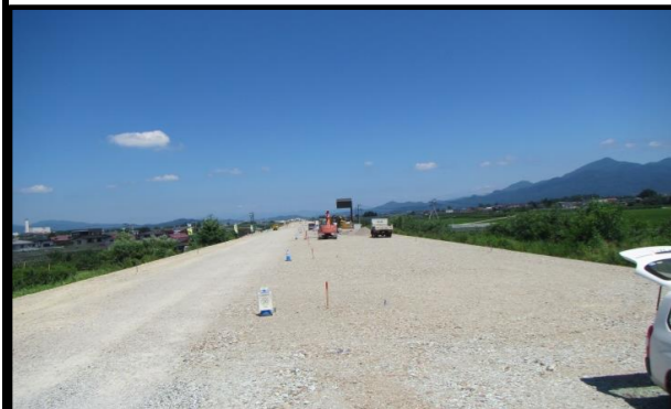
羽入地区(新庄方向)