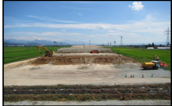
浮沼地区 (山形方向)