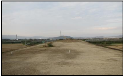
東根北IC(仮称)(新庄方向)