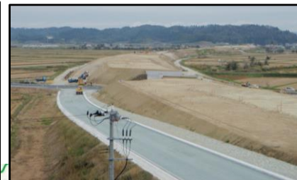
大石田村山IC(山形方向)