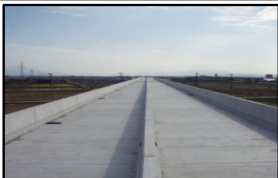
西郷高架橋A2側(山形方向)