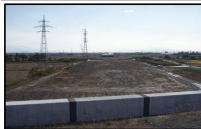
西郷地区(山形方向)