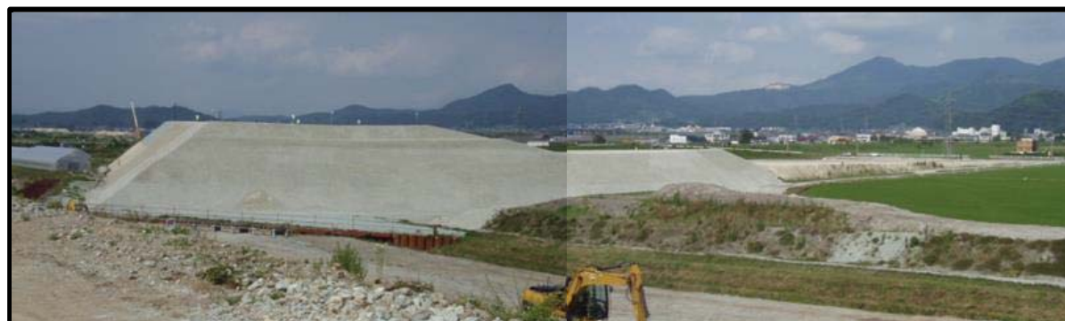
村山IC(仮称)(新庄方向)