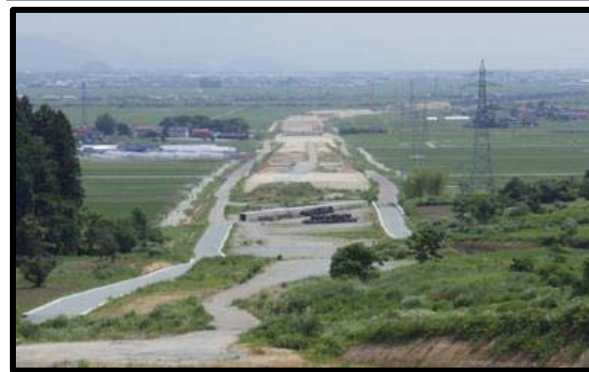
名取地区(山形方向)