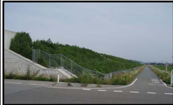
野田地区(新庄方向)