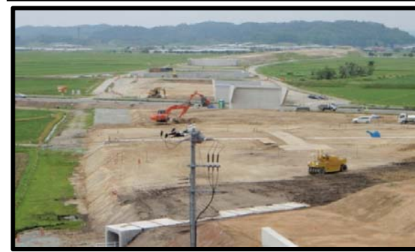
村山大石田IC(仮称)(山形方向)