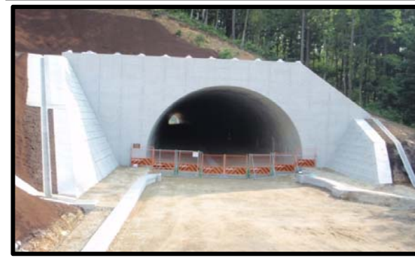
村山トンネル(終点側坑口)