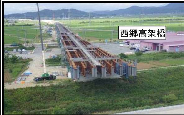
西郷高架橋(仮称)(新庄方向)