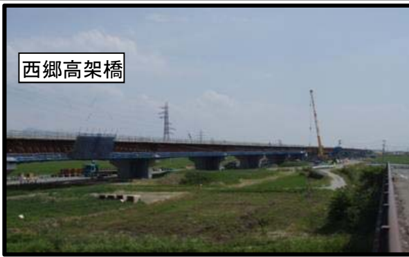
西郷地区(山形方向)