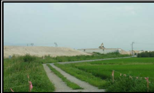
東根北IC(仮称)(山形方向)