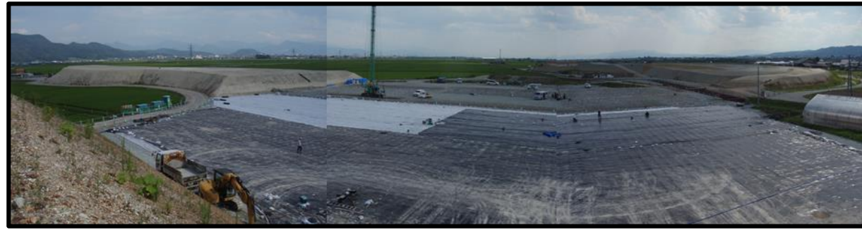
村山IC(仮称)(山形方向)