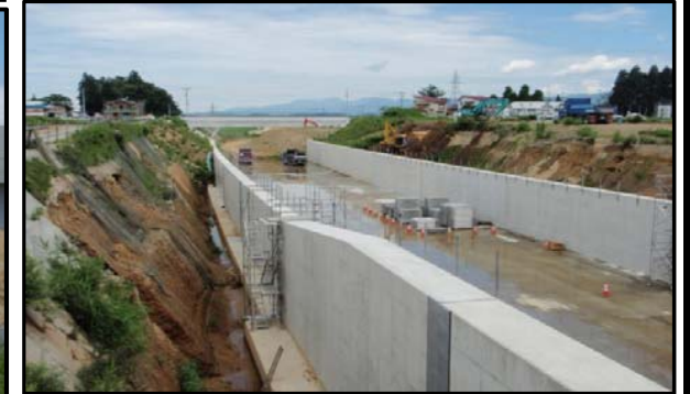
尾花沢地区(新庄方向)