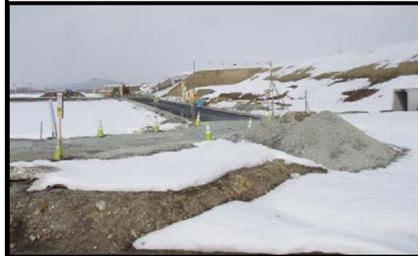
島大堀地区(新庄方向)