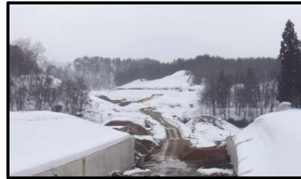
烏木沢地区(山形方向)