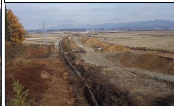
尾花沢地区(新庄方向)