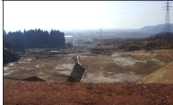
名取地区(山形方向)