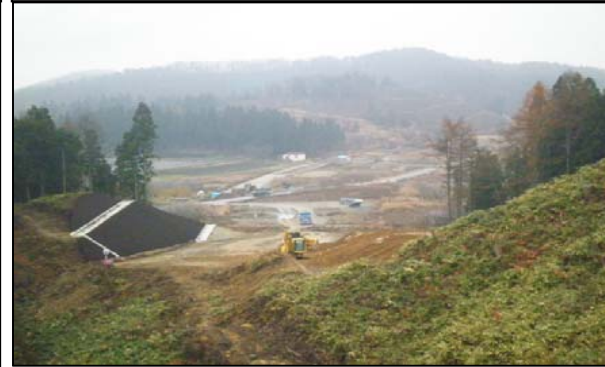
大原口地区(山形方向)