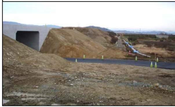
長瀬地区(新庄方向)