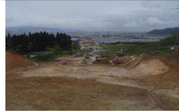
名取地区(山形方向)