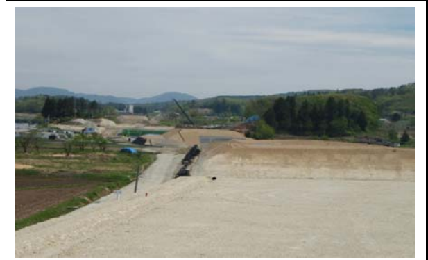
土生田地区(新庄方向)