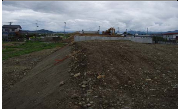
野田地区(新庄方向)