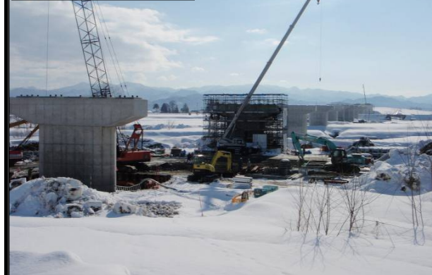
米沢大橋(福島方向)