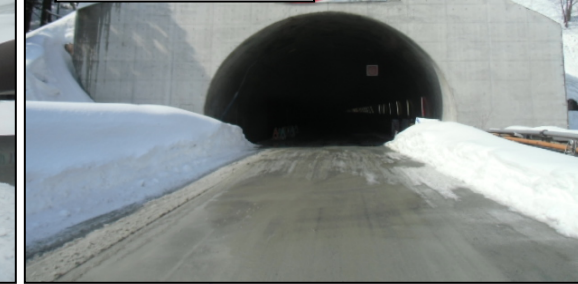
大滝地区(栗子跨道橋)

【福島側】 トンネル延長：5,146m 掘削延長：5,146.0m(100%) 覆工延長：4,701.3m(91.4%) 栗子トンネル(福島側)