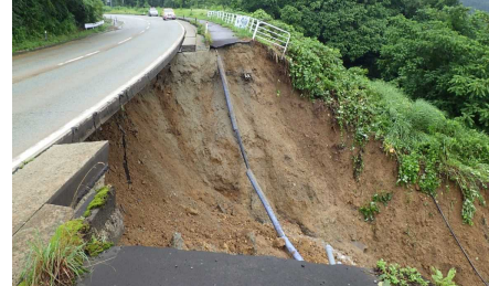
写真③ 舟形町長尾地区(道路崩壊状況)