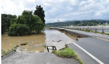
写真② 戸沢村蔵岡地区(道路崩壊状況)