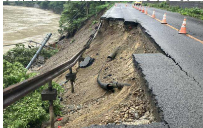
写真① 戸沢村高屋地区(道路崩壊状況)