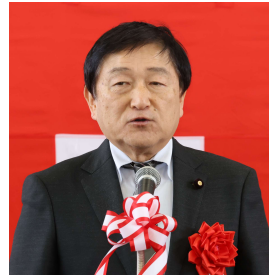
▲芳賀参議院議員 祝辞