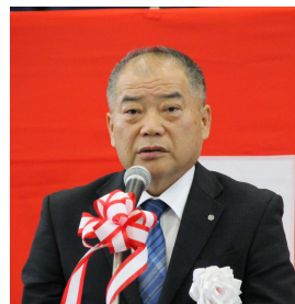
▲加藤戸沢村長 挨拶