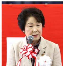
▲吉村山形県知事 挨拶