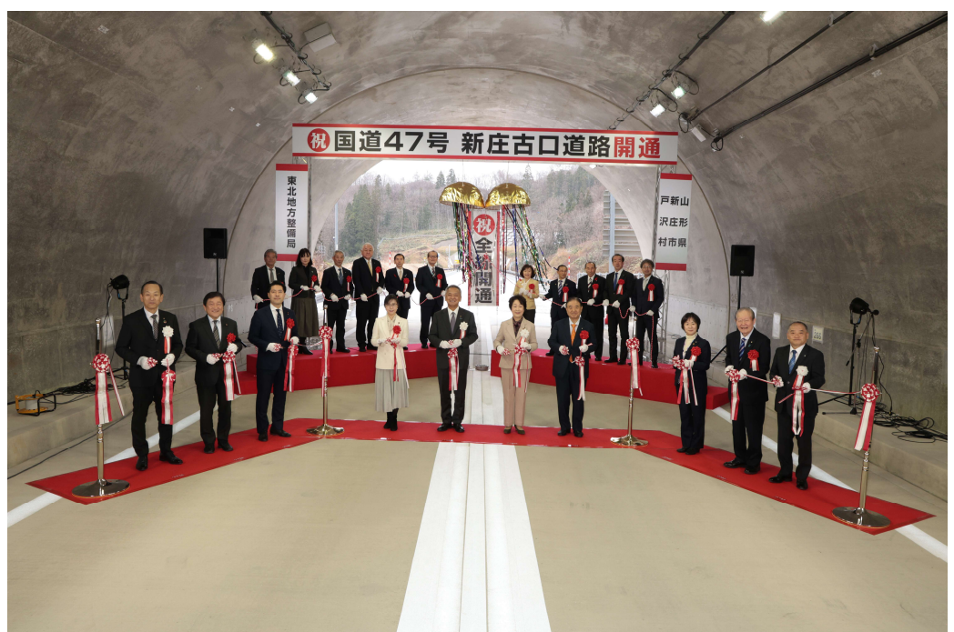
▲テープカット・くす玉開披