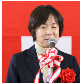
▲舟山参議院議員 祝辞