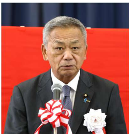
▲高橋国土交通副大臣 挨拶