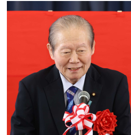
▲佐藤参議院議員 祝辞