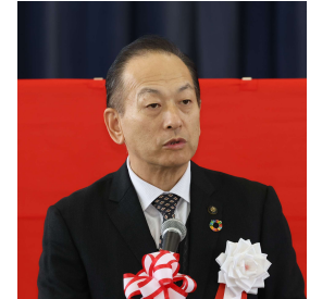
▲山科新庄市長 お礼の言葉