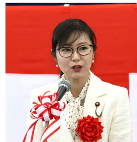
▲加藤衆議院議員 祝辞