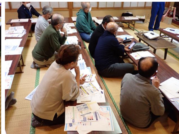
キキクル使用説明