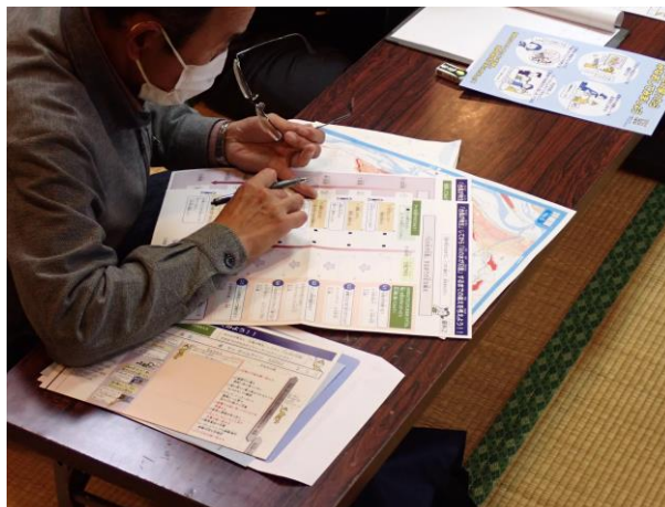
マイ・タイムライン作成