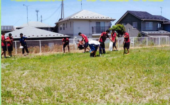
地元高校ボート部と清掃を実施