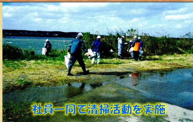
社員一同で清掃活動を実施