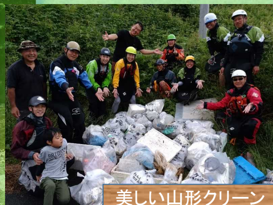
美しい山形クリーンアップキャンペーン