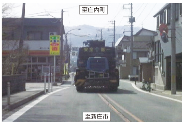
国道47号古口地区の大型車通行の状況