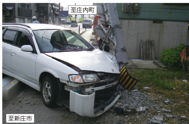
国道47号古口地区の事故発生の状況