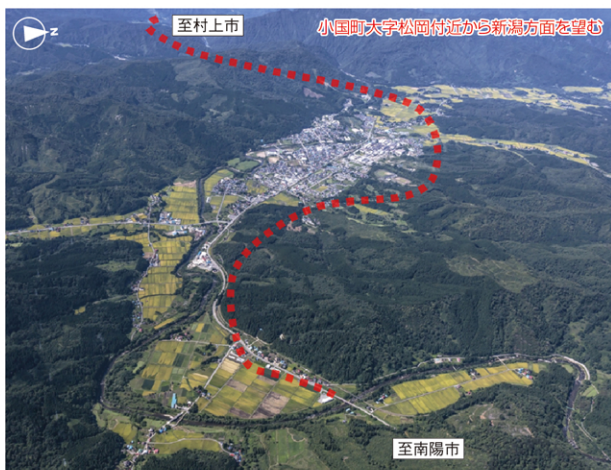
事業区間周辺(航空写真)