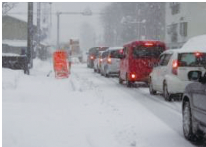
国道113号 小国町内の交通混雑状況