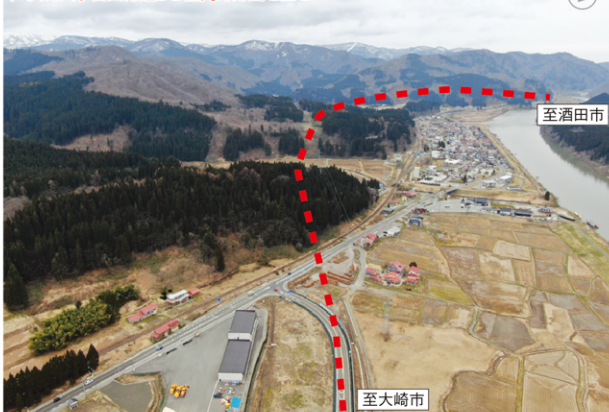
事業区間周辺(航空写真)