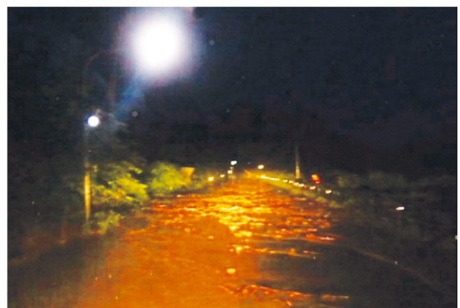
国道47号 戸沢村高屋地区の被災状況(土砂流出)(H30.8.6)