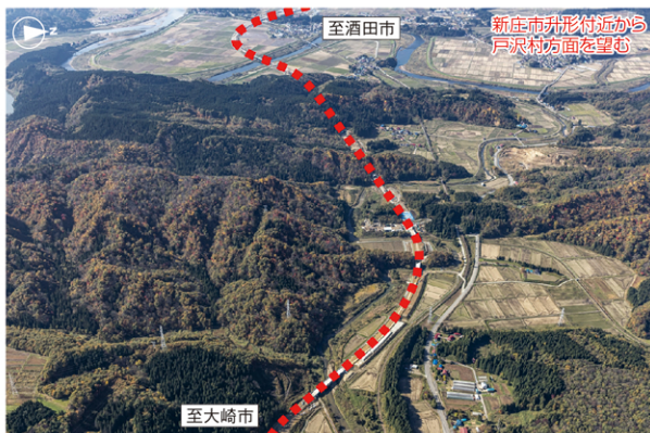
事業区間周辺(航空写真)