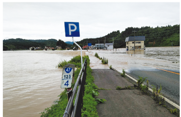
国道47号新庄市本合海地区の被災状況(路面冠水)(R2.7.28)