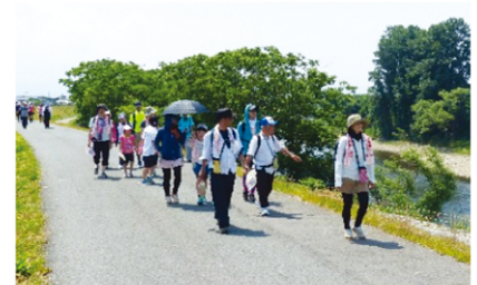
さくらんぼウォーク