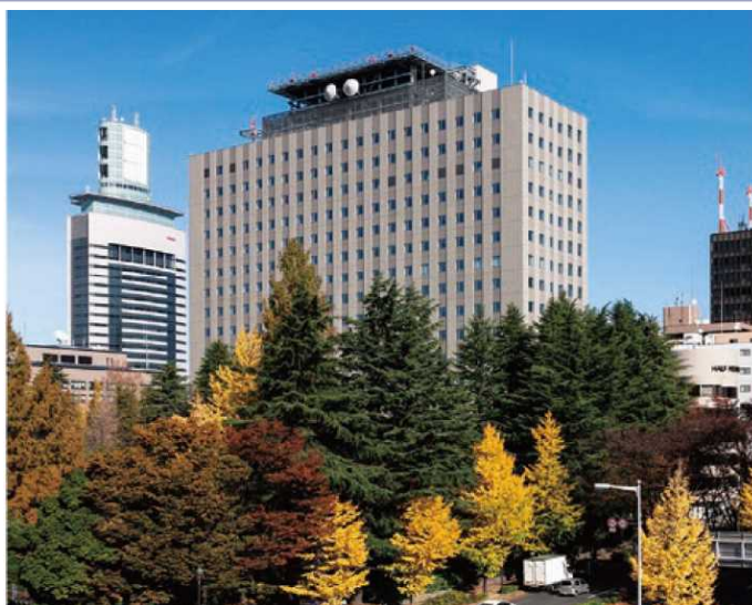
▲東北地方整備局(仙台合同庁舎B棟)

青森県、岩手県、宮城県、秋田県、山形県、福島県を管轄し、道路、河川、ダム、砂防、港湾、空港施設等の整備及び維持管理、建設業や不動産業の許認可に関する業務等を実施。