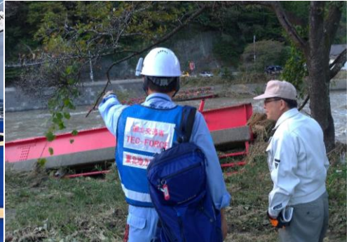
令和元年東日本台風時の対応状況