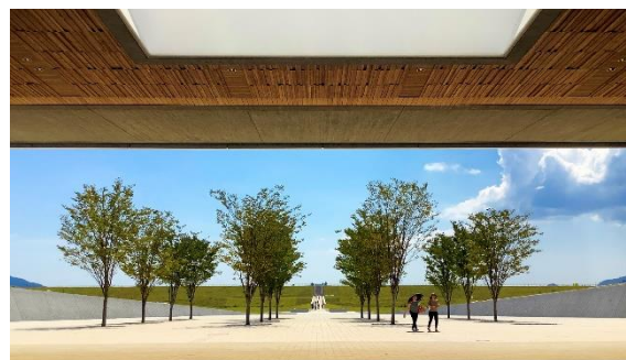
高田松原津波復興記念公園 国営追悼・祈念施設