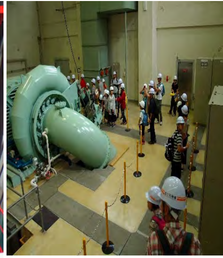
管理用発電所(最大出力3600kw/h)