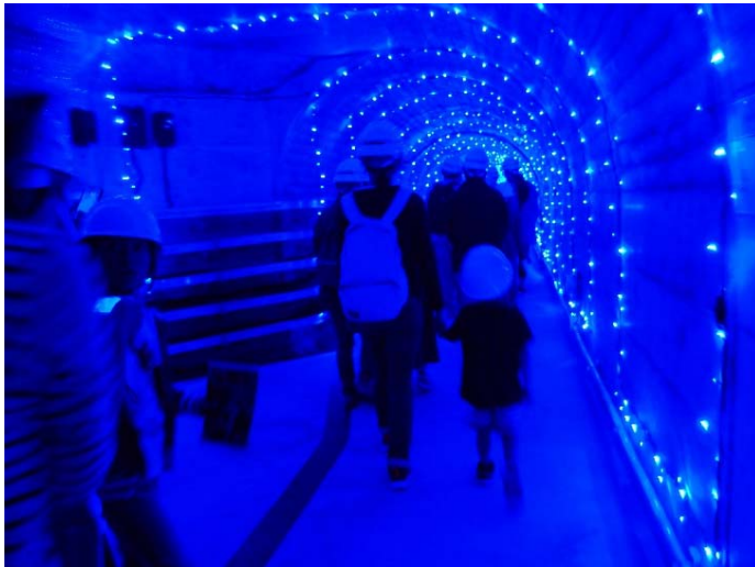
監査廊(イルミネーション)