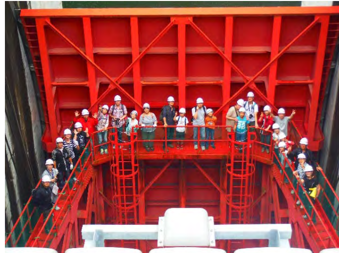
クレストゲート(点検通路の歩行体験)