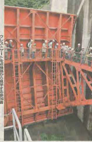
普段入れないトンネルや点検路