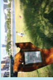
市民団体による看板設置事例 (太田川)