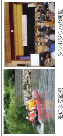
船による監視 シンボジウムの開催