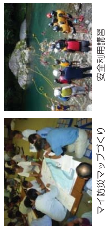
マイ防災マップづくり 安全利用講習