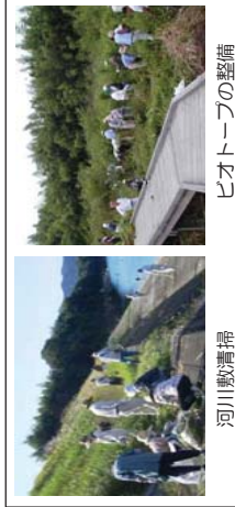
河川敷清掃 ビオトープの整備