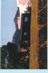
市民団体による活動拠点の整備事例 (佐波川)