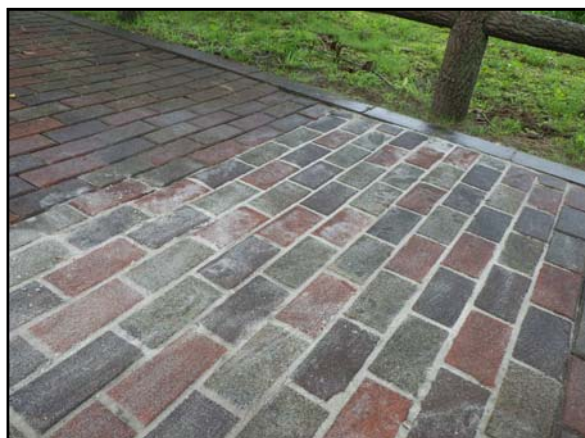
七ヶ宿ダム展望公園の歩道のインターロッキングブロックを補修しました。