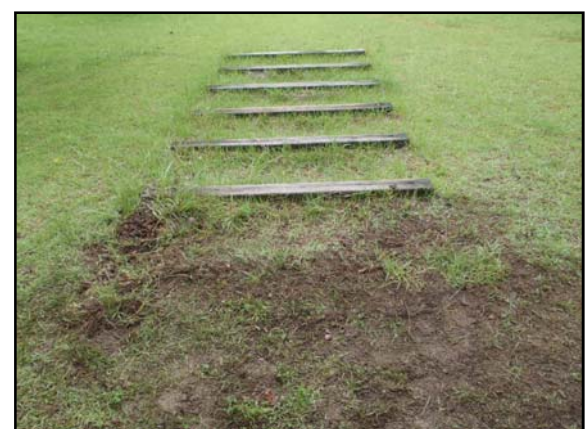
七ヶ宿ダム自然休養公園内遊具について、破損部分を撤去しました。