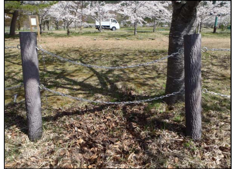
七ヶ宿ダム自然休養公園内の立入防止柵(チェーン柵)を補修しました。