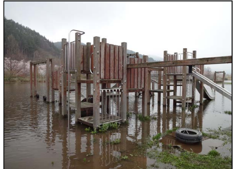
七ヶ宿ダム自然休養公園内のアスレチック遊具を補修が完了するまで使用禁止にしました。(公園利用者へ周知)