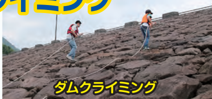
ダムクライミング