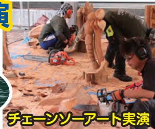
チェーンソーアート実演

※荒天の場合、内容が変更となります。ご了承ください。※参加者多数の場合、先着順となります。ご了承ください。