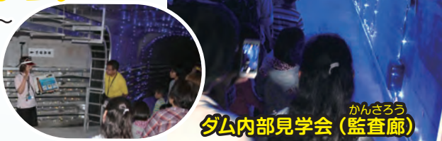
かんさろう ダム内部見学会 (監査廊)