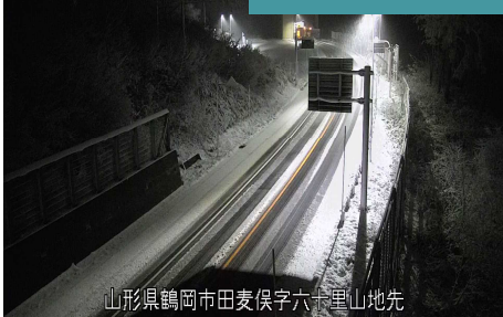
山形県鶴岡市田麦保字六六里山地先