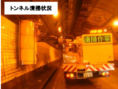
トンネル清掃状況

作業内容により交通規制を行う場合があります。ご迷惑をおかけしますがご理解とご協力をお願いいたします。