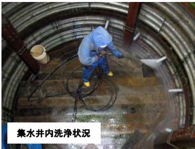
集水井内洗浄状況