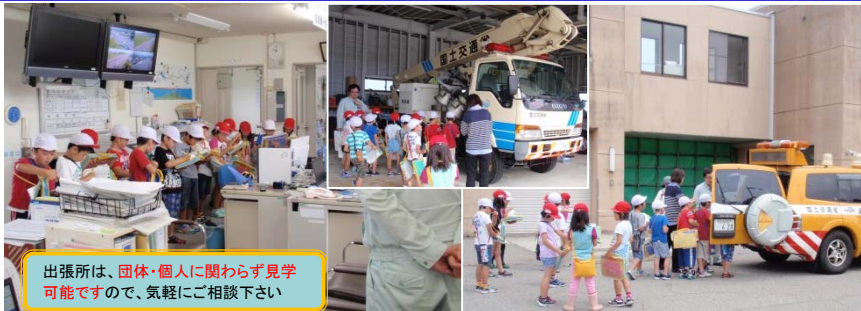
出張所は、団体・個人に関わらず見学可能ですので、気軽にご相談下さい